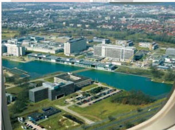
Philips High Tech Campus

om concrete producten, processen en diensten te ontwikkelen. Het gaat niet alleen om beter te presteren dan je concurrent ('outperform'), maar ook om het ontwikkelen van verbeeldingskracht ('outimagine'). Dit heeft gevolgen voor de populatie kenniswerkers in dergelijke 'open source - organisaties'. Kenniswerkers zijn in het bezit van een